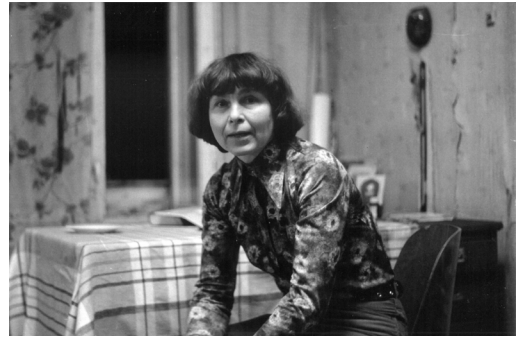
Sofia Gubaidulina