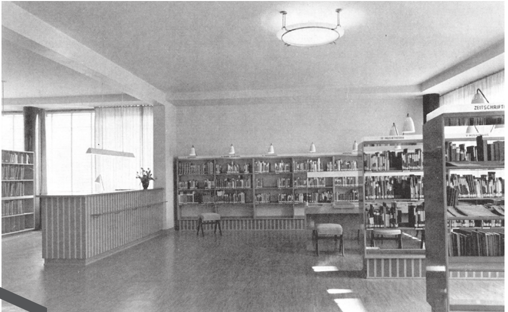
Musikbücherei der Stadtbücherei Düsseldorf, in: Fontes Artis Musicae 1965, H. 1, S. 4ff.