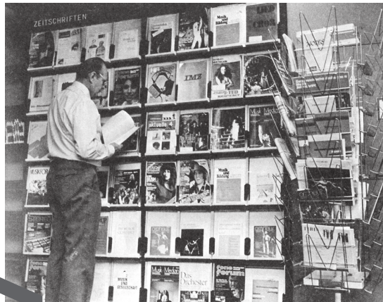
Zeitschriftenabteilung der Frankfurter Musikbibliothek 1979 (Foto: Weiner), in: Musikleben und Musikbibliothek: Beiträge zur musikbibliothekarischen Arbeit der Gegenwart , hrsg. von Hermann Waßner, Berlin 1979, S. 38

Gründung des RIPM (Répertoire International de la Presse Musicale)