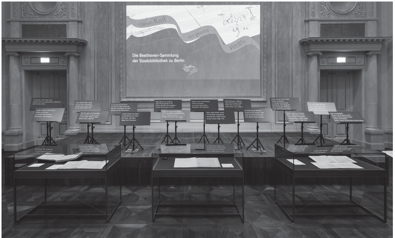
Abb. 4: Präsentation von Beethovens 9. Sinfonie

onen, der Oper Leonore/Fidelio , von der Quellen zu allen drei Fassungen in Berlin vorhanden sind, Beethoven-Porträts und – um doch aus dem System ‚auszubrechen‘ – dem Aufenthalt Beethovens in Berlin 1796. Da sich damit die spätere Widmung der 9. Sinfonie an den preußischen König Friedrich Wilhelm III. (1770–1840) anbahnte, war in räumlicher Nachbarschaft die Station zu diesem Werk verortet, dramaturgisch der Höhepunkt der Ausstellung (s. Abb. 4).