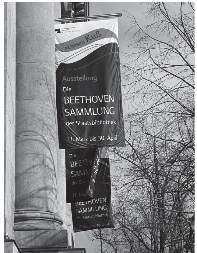
Abb. 1: Fahnen am Gebäude der Staatsbibliothek zu Berlin

Ludwig van Beethoven war nur einmal, im Jahr 1796, in Berlin, aber der Zufall will es, dass er sich gerade auch an dem Ort der Stadt aufhielt, an dem sich heute die weltweit umfangreichste Sammlung seiner Autographe befindet. Denn zwei Auftritte Beethovens vor den Mitgliedern der