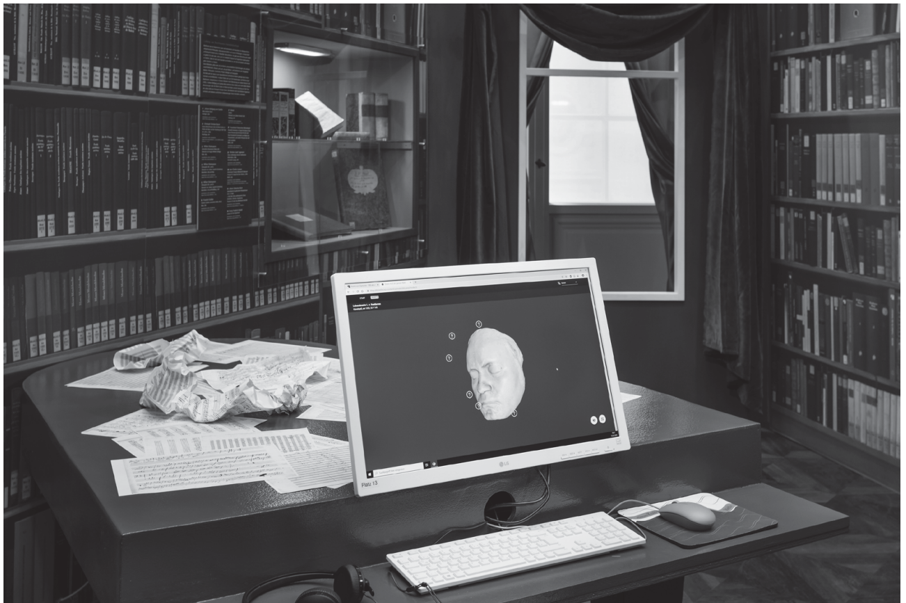
Abb. 6: Nachbau von Beethovens „Studierzimmer“ in Wien mit Digitalen Angeboten, hier die Lebendmaske als 3D-Scan

Wochenlang war nicht klar, ob die Ausstellung, deren Aufbauten während dieser Zeit im Ausstellungsraum verblieben waren, nochmals öffnen könnte. Nachdem die Lockerungen des Berliner Senats dann eine Wiedereröffnung möglich gemacht hatten, wurde die Ausstellung unter strengen Hygiene-Auflagen, die z. B. erhöhte Reinigungsintervalle der Flächen und Touchscreens vorsahen sowie natürlich die Maskenpflicht beim Betreten des Hauses umfasste, wiedereröffnet. Nur 18 Besucherinnen und Besucher durften gleichzeitig für je eine Stunde in die Ausstellung, für die kostenfrei Zeitfenstertickets gebucht werden mussten. Das geplante Führungsprogramm wie auch die Begleitveranstaltungen wurden ersatzlos gestrichen. Wie viele weitere Kulturveranstaltungen im Beethoven-Jahr durch die Corona-Pandemie abgesagt, verschoben oder ganz neu organisiert werden mussten, wird wohl nicht zu ermitteln sein.